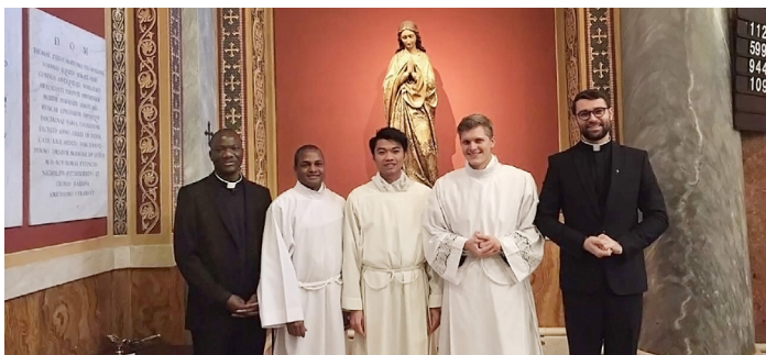
Alle samlet til akolytat i Roma 18. desember